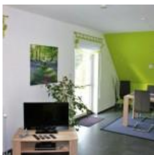
SAT-TV / DVD / WLAN

Der Essbereich ist großzügig und modern gehalten. Hier können Sie bequem zu Zweit oder auch mit Ihrer Familie speisen. Vom Essbereich aus haben Sie eine sehr schöne Sicht durch die Balkontür auf die 18 m 2 große Dachterrasse sowie auf eine sehr gepflegte Wohnsiedlung. Zu fortgeschrittener Tageszeit haben Sie hier auch einen schönen Ausblick auf einen wunderschönen Sonnenuntergang. Die Essecke lädt zum Essen ein, aber auch um den Abend vielleicht mit Gesellschaftsspielen ausklingen zu lassen. Das bleibt Ihnen überlassen.