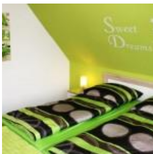
Schlafzimmer 2 mit Rollo

Unsere Schlafzimmer sind gemütliche Kuscheloasen zum Relaxen und Träumen. Tauchen Sie ein in eine moderne Schlafatmosphäre in frischen Farben mit großem Wohlfühlfaktor. In jedem Schlafzimmer steht ein großer Kleiderschrank, worin alle Kleiderstücke genug Platz finden. Die Betten sind mit komfortablen Matratzen ausgestattet.