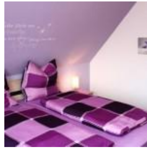
Schafzimmer 1 mit Rollo