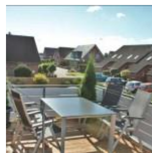
18 m 2 Dachterrasse

Der Essbereich ist großzügig und modern gehalten. Hier können Sie bequem zu Zweit oder auch mit Ihrer Familie speisen. Vom Essbereich aus haben Sie eine sehr schöne Sicht durch die Balkontür auf die 18 m 2 große Dachterrasse sowie auf eine sehr gepflegte Wohnsiedlung. Zu fortgeschrittener Tageszeit haben Sie hier auch einen schönen Ausblick auf einen wunderschönen Sonnenuntergang. Die Essecke lädt zum Essen ein, aber auch um den Abend vielleicht mit Gesellschaftsspielen ausklingen zu lassen. Das bleibt Ihnen überlassen.